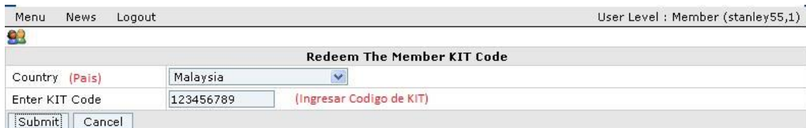
Figura 2.1.1 Recuperación de Código de KIT de Miembro