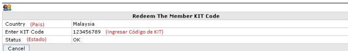
Figura 2.1.3 Recuperación de Código de KIT de Miembro