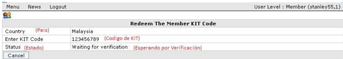
Figura 2.1.2 Recuperación de Código de KIT de Miembro