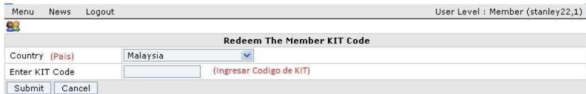
Figura 2.1.0 Recuperación de Código de KIT de Miembro