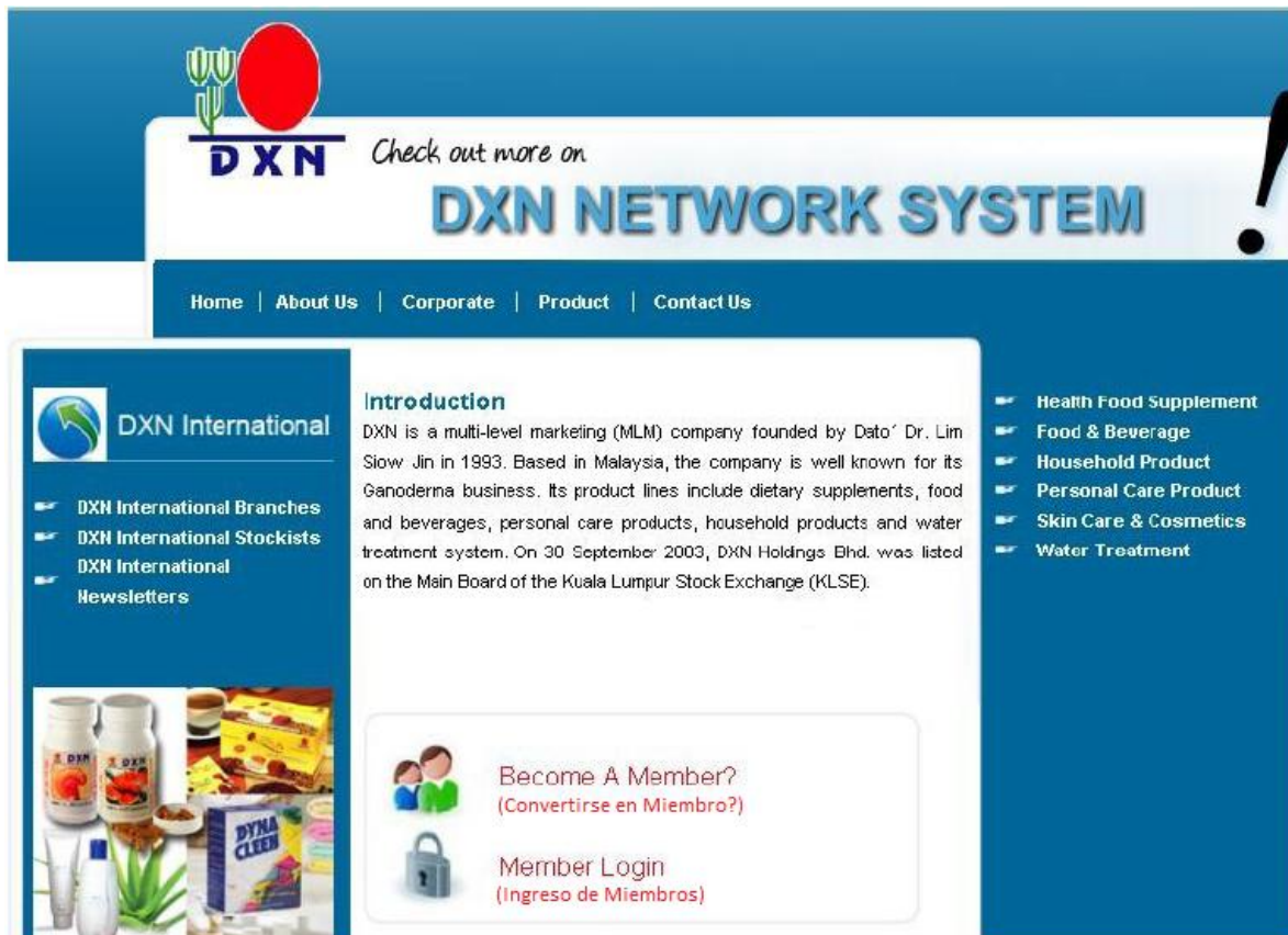
Figura 1.1.0: Página Principal